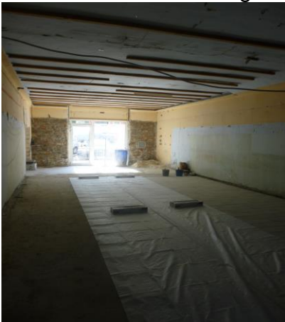
Juin 2018, un bel espace où tout est à faire.