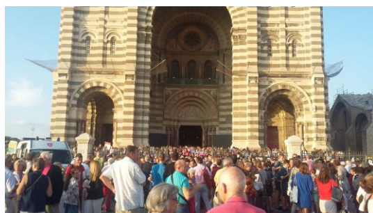
Une foule immense est rassemblée dans et hors de la cathédrale pour ce grand jour de la béatification de Jean-Baptiste Fouque, géant de la charité, amoureux du Christ à travers les « petits ».

Le 3 septembre 2018, les écoliers découvrent des locaux tout neufs et fraîchement peints : 30 élèves pour une classe de maternelle et deux classes de primaire. * * * Ouvert avec 3 élèves en 2015, le cours Jean-Baptiste Fouque grandit sous la protection de son inspirateur béatifié le 30 septembre 2018 à Marseille.