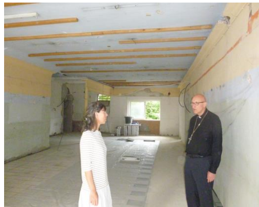
Mgr Rey encourage le projet.