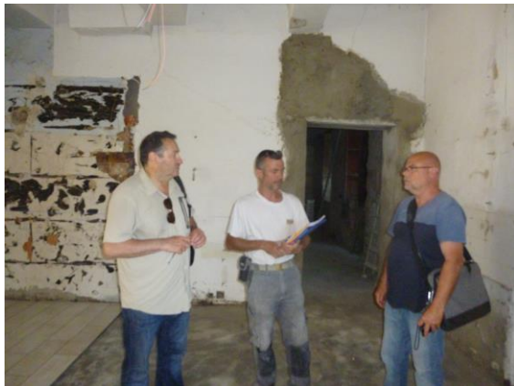
Juillet - Août la course contre la montre